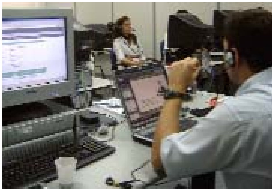
Cursos na área de informática, qualificam servidores para melhor desempenho

• O TRT potiguar irá se adequar ao sistema de Gestão e Política de Investimento, utilizando como base o modelo implantado no TRT 3ª Região. A idéia é haver não só uma mudança no organograma do tribunal em termos de