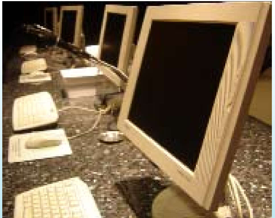
Novos equipamentos foram adquiridos e novos sistemas estão sendo desenvolvidos

A tecnologia Wi Fi permite o acesso em três tipos de banda: A, B e G. Os testes estão sendo feitos em torno da banda B, que permite acesso a uma velocidade de 11 Mbits. Mas a banda a ser adotada será a G, por ser uma banda de maior tráfego e