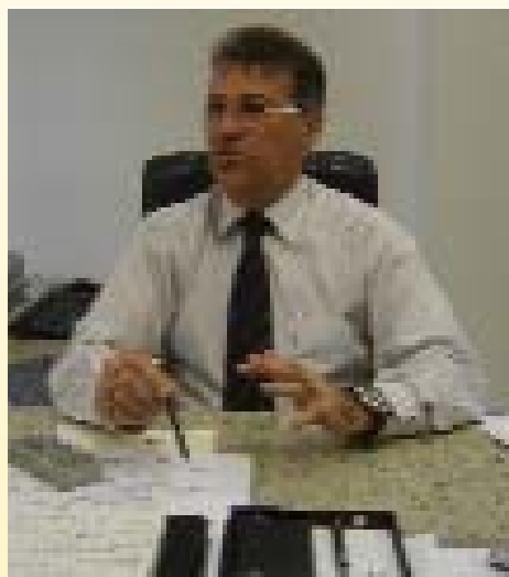
Des. Eridson Medeiros

O presidente do tribunal, des. Eridson Medeiros já vem colocando em prática o seu discurso de Transparência e Efetividade em sua administração. O presidente vem criando várias comissões, com representantes de vários setores, com o intuito de dar a maior transparência possível às ações do tribunal.