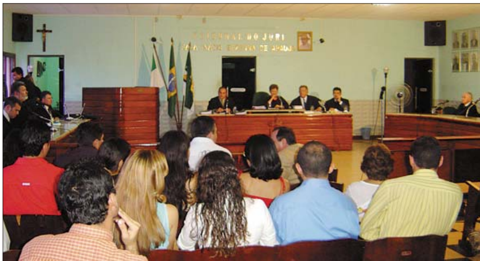
A Corte do Tribunal julgou os recursos das Varas Trabalhistas do Seridó

Estudantes do curso de Direito da UFRN-Caicó foram convidados e assistiram aos julgamentos dos processos como forma de ampliar o conteúdo dos conhecimentos acadêmicos. Foi possível, inclusive, a participação de advogados das partes nos processos, que fizeram