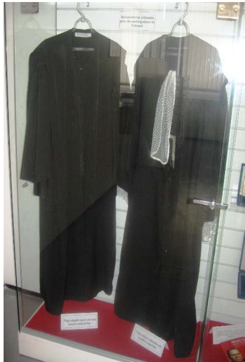
TOGA SIMPLES E TOGA SOLENE