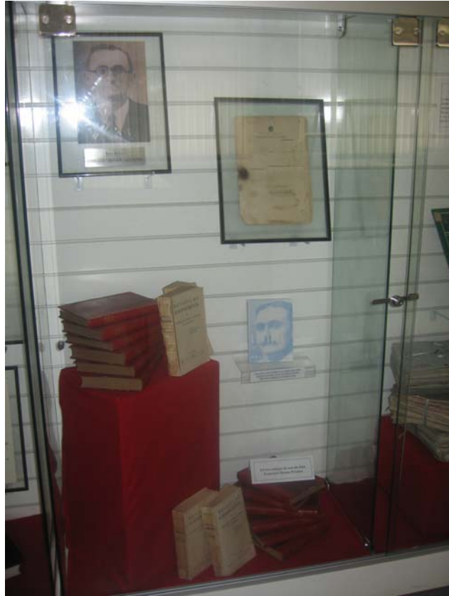
Primeiro Juiz do Trabalho do Rio Grande do Norte