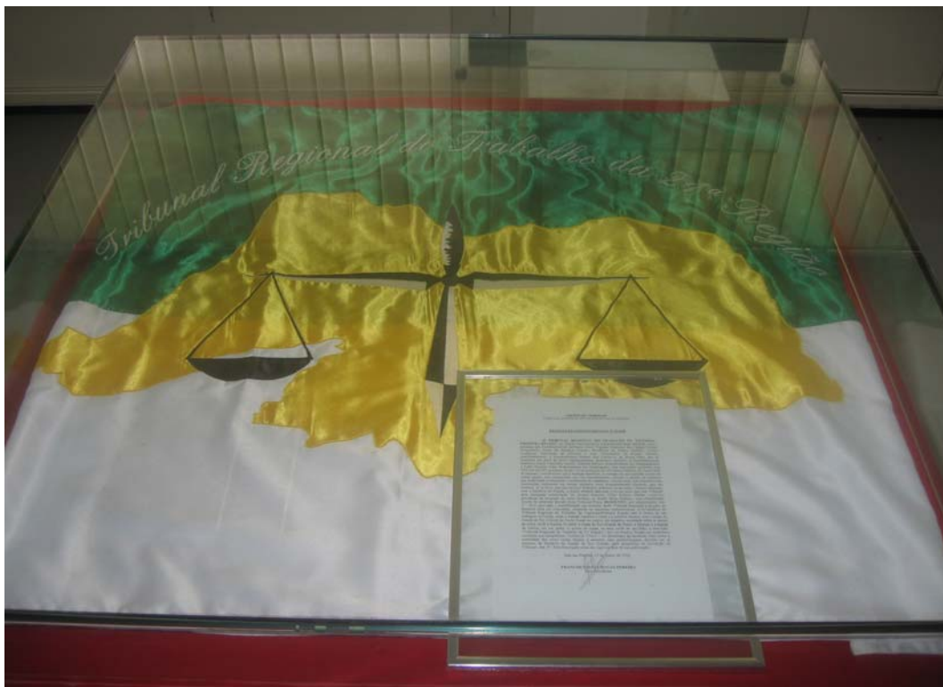
BANDEIRA DO TRIBUNAL REGIONAL DO TRABALHO DA 21ª COM A RESOLUÇÃO ADMINISTRATIVA Nº 015/98, DATADO DE 19 DE MARÇO DE 1998.