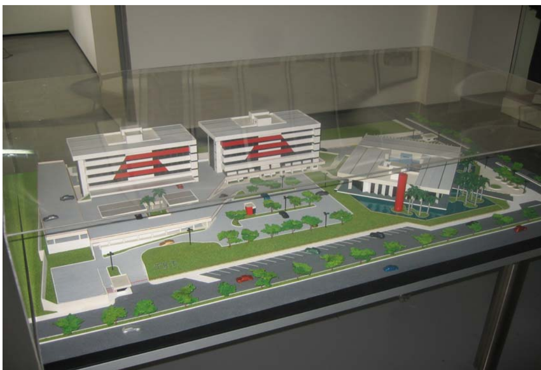
MAQUETE DAS INSTALAÇÕES DO TRT DA 21ª REGIÃO